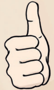
Finde Deine Teil-Habe-Wünsche